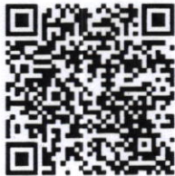
Mã QR Audio